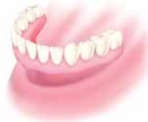
Protesi mobile Senza stabilità.