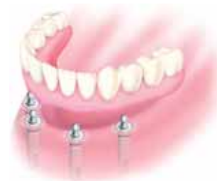
Protesi mobile rimovibile La protesi è rimovibile ma stabile.