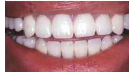
Dopo il posizionamento degli impianti il paziente possiede una dentizione completa e stabile, perfettamente funzionante e gradevole alla vista.