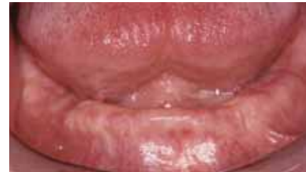
Prima del posizionamento dell'impianto il paziente è privo di tutti i denti e rischia di perdere l'osso.