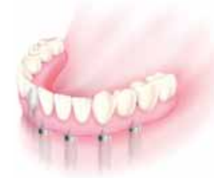
Impianti che supportano la protesi La protesi è stabile e non rimovibile.