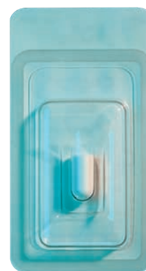
Cat. # 0102 Garze CollaPlug 1,0 x 1,9 cm

Un comodo dispensatore consente di avere le garze della Zimmer Dental a portata di mano durante le procedure.