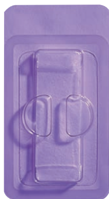
Cat. # 0100 Garze CollaTape 2,5 x 7,5 cm

Le garze di collagene riassorbibili sono fornite in confezioni sterili, singole, a bolla d'aria, nei seguenti formati: