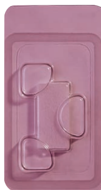
Cat. # 0101 Garze CollaCote 1,9 x 3,8 cm